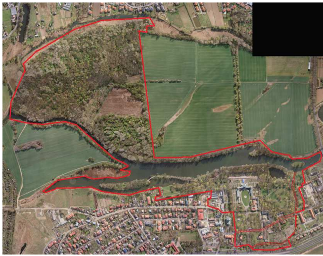
Zdjęcie lotnicze rezydencji wilanowskiej z oznaczeniem granic Muzeum Pałacu w Wilanowie, 2005 r., fot. MGGP Aero Sp. z o.o., Tarnów (wł. Muzeum Pałac w Wilanowie). Granice muzeum naniósł P. Szpanowski.

Muzeum odpowiedzialne za tego rodzaju zasoby zintensyfikowało pozyskiwanie środków na prace konserwatorskie i rewaloryzacyjne, które rozpoczęto 2003 r. i kontynuowano do 2013 r. - początkowo ze środków z budżetu Ministra Kultury i Dziedzictwa Narodowego, od 2005 r. ze środków z Europejskiego Funduszu Rozwoju Regionalnego, od 2007 r. z Mechanizmu Finansowego Europejskiego Obszaru Gospodarczego (EOG), od 2009 r. z priorytetu XI Programu Operacyjnego Infrastruktura i Środowisko (POIiŚ), od 2010 r. z Regionalnego Programu Operacyjnego Województwa Mazowieckiego 2007–2013. Prowadząc prace na własnym terenie muzeum żywo interesowało się zagospodarowaniem jej bliższego i dalszego otoczenia.” 63