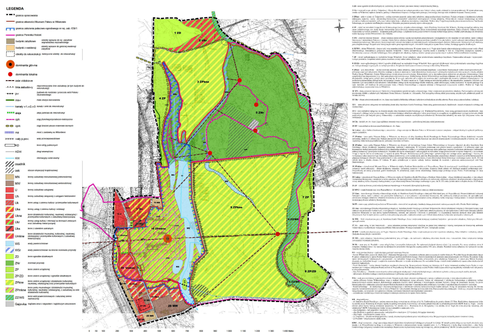
Muzeum Pałac w Wilanowie - propozycja ustaleń do projektu planu zagospodarowania przestrzennego rejonu pałacu w Wilanowie z Morysinem

Muz. Pałac w Wilanowie - propozycja ustaleń do projektu planu zagospodarowania przestrzennego rejonu pałacu w Wilanowie z Morysinem, 30 sierpnia 2013 r., oprac. graf. E. Jakubowska-Smagieł, zatw. P. Jaskanis, dyr. Muz. Pałacu w Wilanowie.